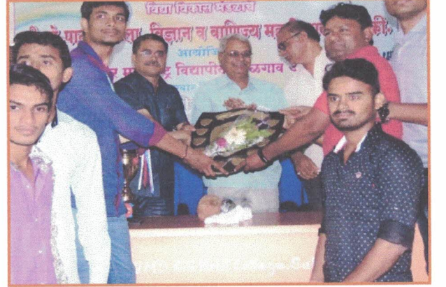
तृतीय स्थान प्राप्त कला महाविद्यालय, बामखेडा ला तृतीय स्थान करंडक देताना सन्माननीय मान्यवर