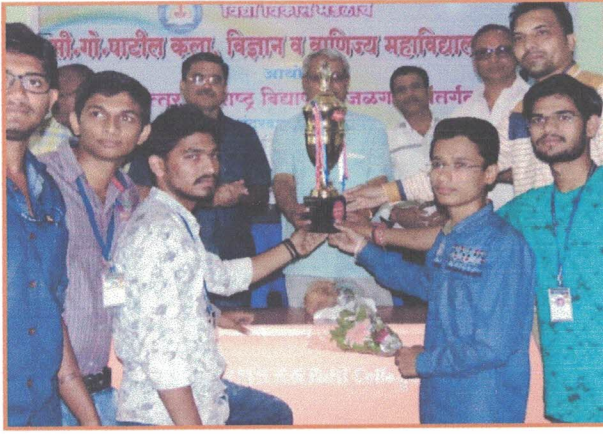
उपविजयी संघ पु.सा.गु.वि.प्र. कला, वाणिज्य व विज्ञान महाविद्यालय, शहादा ला उपविजयी करंडक देताना सन्माननीय मान्यवर