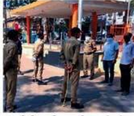
एनसीसीच्या विद्यार्थ्यांना मार्गदर्शन करताना अधिकारी