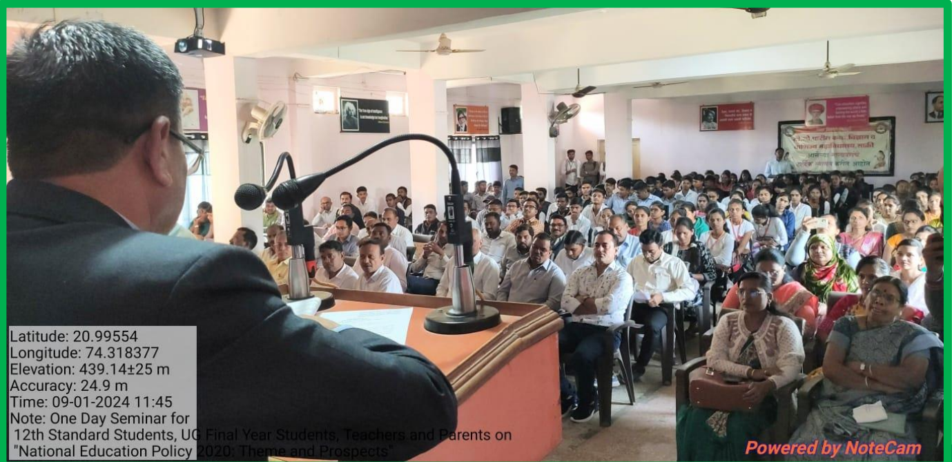
Participants (12 Std Students, UG Final Year Students, Parents and Teachers) attending the Seminar