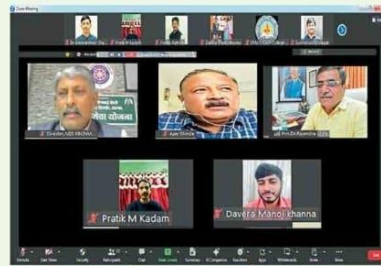
साक्री : सी. गो. पाटील महाविद्यालयात राष्ट्रीय वेबिनारसाठी ऑनलाइन मार्गदर्शन करताना विविध क्षेत्रातील मान्यवर.