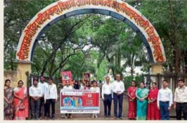
साक्री : सी. गो. पाटील महाविद्यालयात एड्स जनजागृती रॅलीत सहभागी विद्यार्थी व प्राध्यापक.