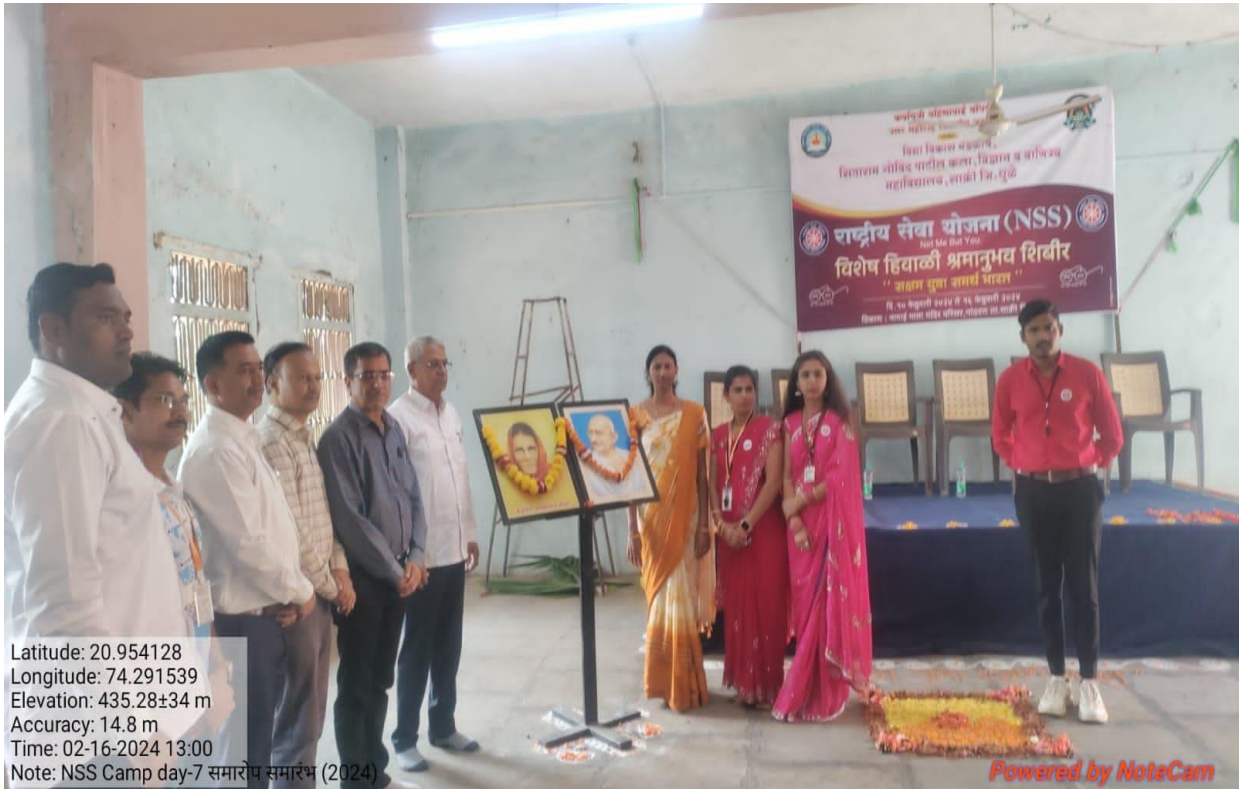
Latitude: 20.954128 Longitude: 74.291539 Elevation: 435.28±34 m Accuracy: 14.8 m Time: 02-16-2024 13:00 Note: NSS Camp day-7 समारोह समारंभ (2024)