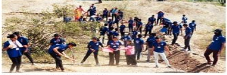
श्रमदान करताना विद्यार्थी, विद्यार्थिनी.